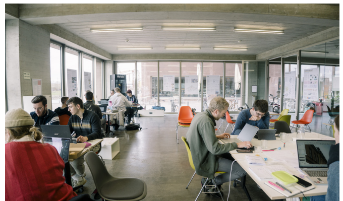
Abbildung 1: Exkursion